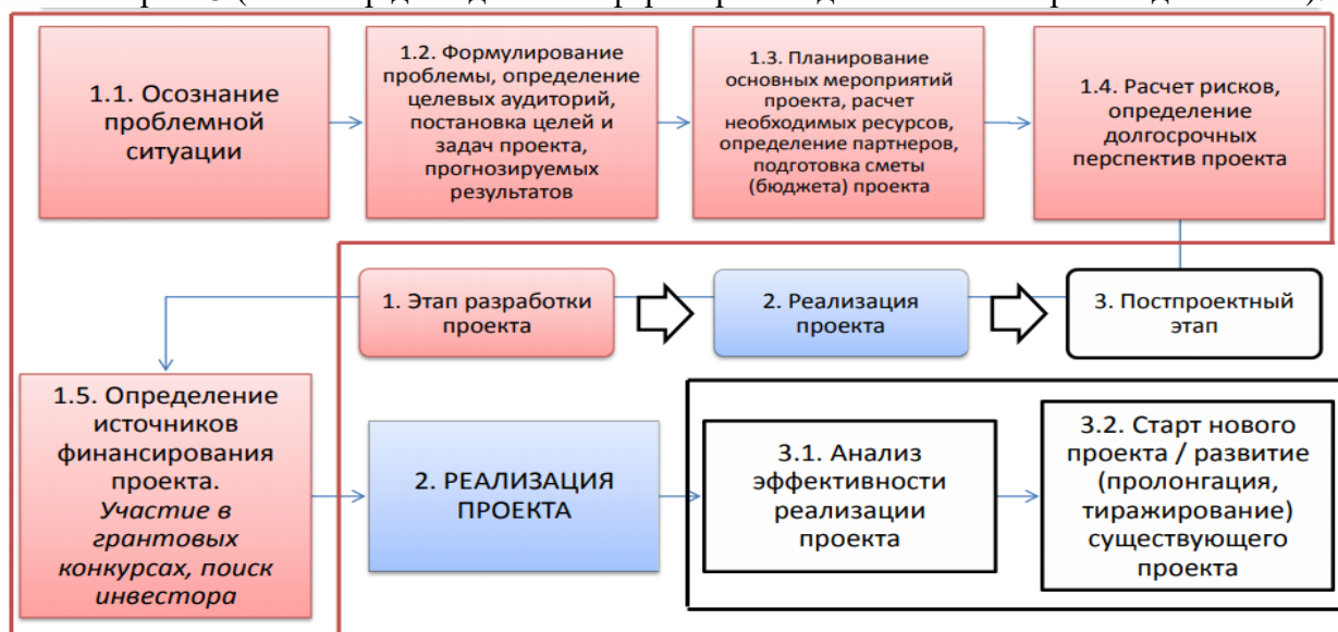
Рис. 2. Схема-алгоритм создания бизнес-модели в инновационной экономике.

Задание. Изучите материал представленных на сайте [ https://www.openbusiness.ru ] описаний готовых руководств для разработки бизнес-планов и составьте алгоритм создания бизнес-модели в инновационной экономике производственной / непроизводственной сферы по схеме на рис. 2 и бизнес-модель бизнес-модели в инновационной экономике по схеме на рис. 3 (на выбор для одной из сфер – производственной / непроизводственной):